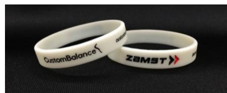
▼①蓄光リストバンド

ザムストブースにお立ち寄りいただいた方に、各日先着1,500名様限定で、ナイトランでも目立って安全な「蓄光リストバンド」を差し上げます！