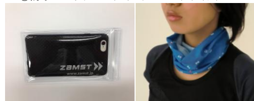
▼②防水スマホケース(左)とターバンダナ(右)

ブース内で商品を購入いただくと、もれなくランニング時に活躍する「防水スマホケース」もしくは「ターバンダナ」をプレゼントいたします。（数量限定）