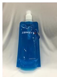
▼④携帯ウォーターボトル(カラビナ付)

世界30カ国以上に商品展開をしているザムストは、英語が話せるスタッフやパンフレットも用意し、積極的に海外ランナーを応援。ブース内でアンケートにお答えいただいた海外ランナー限定で「携帯ウォーターボトル」をプレゼントいたします。（数量限定）