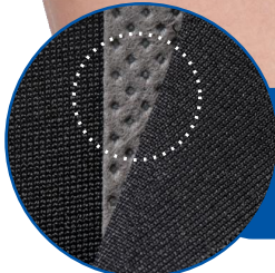
ストラフレックス®