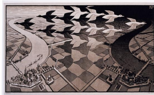
《昼と夜》 M.C. エッシャー 1938年 板目木版二色刷り

© 2024 The M.C. Escher Company, The Netherlands. All rights reserved. www.mcescher.com