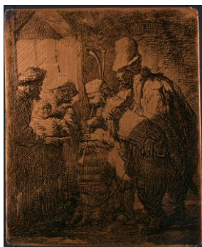
左：《門付けをする楽士たち》 レンブラント・ファン・レイン 1935年 銅板

本展覧会では、レンブラントを始め、17世紀以降のオランダに関するハウステンボスの収蔵品の数々を使って、その影響と関係性に迫ります。