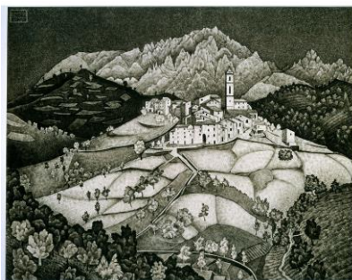
《ソペリア(コルシカ)》 M.C. エッシャー 1928年 ドローイング

よく知られているのはだまし絵や数学的な作品ですが、キャリアの初期には風景や身近な物を版画にしています。それらは粗削りな点もありながら、様々な技法を模索し、また後の作品にも通じる独自の視点や表現方法を見る事ができます。