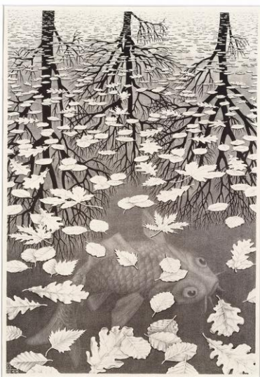
《三つの世界》 M.C. エッシャー 1955年 リトグラフ