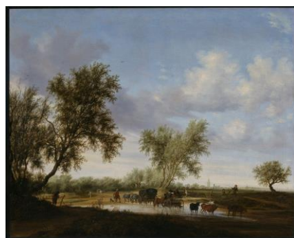
右：《旅人のいる風景》サロモン・ファン・ロイスダール 1945年 油彩、キャンバス