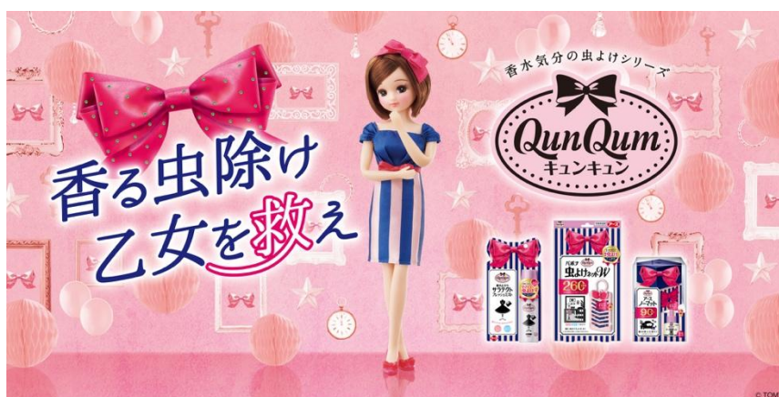
WEBと連動したキービジュアル イメージ

アース製薬株式会社（本社：東京都千代田区、代表取締役社長：川端克宜）の「大人かわいい」虫ケア用品「QunQum -キュンキュン-」は「リカちゃん」（発売元：株式会社タカラトミー）とコラボレーションし、5月1日（火）よりWEBサイトと限定ムービーを公開いたします。