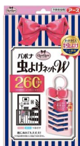
『バボナ 虫よけネットW』