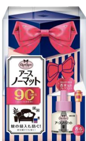
『アースノーマット』

製品ラインナップ一覧： https://www.earth.jp/qunqum/#qunqum-lineup