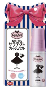
『服の上からサラテクト フレッシュミスト』