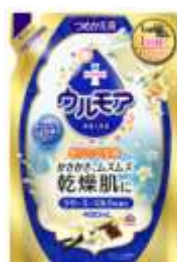
『 クリーミーミルク 』