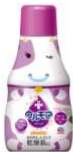
『 クリーミーフローラル 』