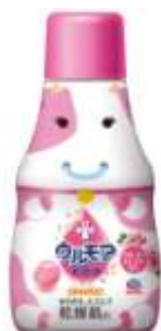
『 クリーミーローズ 』