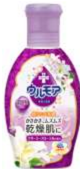
『クリーミーフローラル』