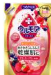
『 クリーミーベリー 』