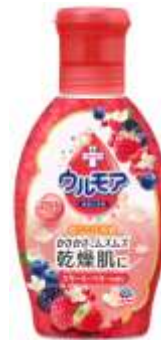
『クリーミーベリー』

『保湿入浴液ウルモア』は、“素肌の乾燥に着目した保湿入浴液”をコンセプトに2010年9月に発売以降、うるおい効果が感じられるとして、多くのお客様から好評を博しております。当社が実施した液体入浴剤のイメージ調査では、「肌がしっとりする 64.3%」「肌の乾燥を防ぐ 57.4%」「肌にやさしい 55.7%」が上位を占めました。