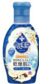
『クリーミーミルク』