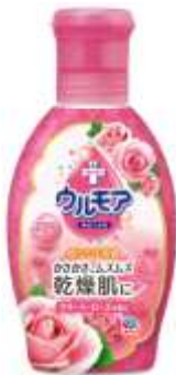
『クリーミーローズ』

アース製薬株式会社（本社：東京都千代田区、代表取締役社長：川端克宜）は、素肌の「乾燥」に着目した液体入浴剤『保湿入浴液ウルモア』シリーズを、8月21日より全国で改良新発売いたします。