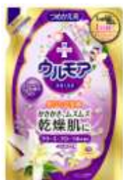
『 クリーミーフローラル 』