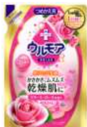
『 クリーミーローズ 』