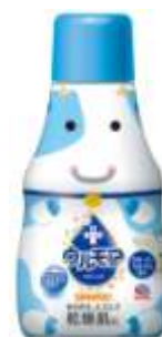
『 クリーミーミルク 』