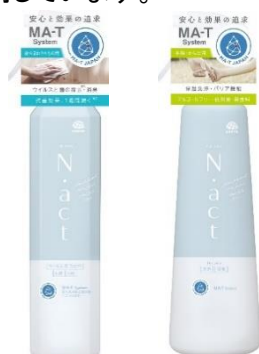
除菌・消臭スプレー（左）、肌用クリーンミスト 『N.act』のロゴ

アース製薬株式会社（本社：東京都千代田区、社長：川端克宜、以下「アース製薬」）は、『N.act 除菌・消臭スプレー』『N.act 肌用クリーンミスト』など 3 製品を全国発売しています。『N.act』は、“新しい生活に寄り添う”をコンセプトに誕生した当社の新ブランドで、革新的な酸化制御技術「MA-T」※1を活用しています。