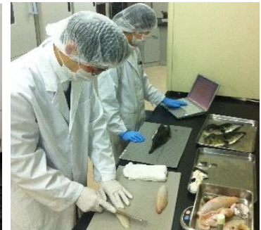
【関門海 研究開発部門の様子】

今回、関門海との販売包括契約を結び、関門海が「玄品」で提供している品質の高いとらふぐから抽出したコラーゲンを利用することが可能となりました。また、当社が持つ商品開発力で、コラーゲン特有の味・ニオイをマスキングし、美容・健康のため毎日継続できる風味に加工しました。さらに、厳しい品質管理体制で、天然原料を一定の水準に管理することに加えて、効率的なサプライチェーンで低コスト化を図り、リーズナブルな価格帯での販売を実現しました。