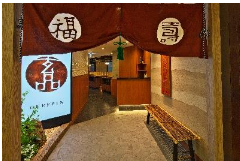
【とらふぐ料理専門店「玄品」店舗の様子】

また、社内に研究開発部門を抱え、養殖とらふぐを天然の味に近づけるための旨味成分向上技術など、とらふぐの価値をさらに向上させる様々な技術を研究してきた実績があります。