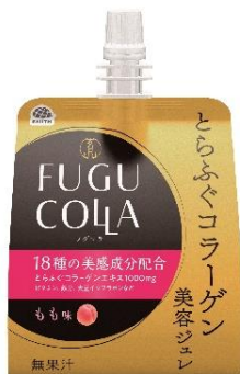
【とらふぐコラーゲン美容ジュレ】 ～もも味～

アース製薬株式会社（本社：東京都千代田区、社長：川端克宜、以下「アース製薬」）は、希少な高級魚とらふぐの良質なコラーゲンを原料とした「とらふぐコラーゲン美容ジュレ」（もも味、キウイ味の2種類）を、全国展開するドラッグストアで6月1日より限定発売いたします。