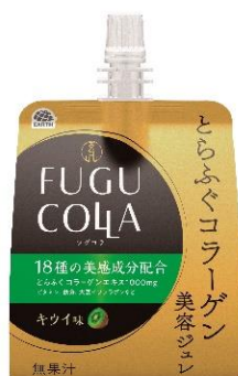
【とらふぐコラーゲン美容ジュレ】 ～キウイ味～

とらふぐは、ふぐの中でも高価なため、ふぐ料理店などでは「ふぐの王様」とも呼ばれています。ただ、近年資源量が減少しており、水産庁でも「トラフグ資源管理検討会議」を立ち上げ、対策を検討しているほど希少価値のある魚となっています。そのため、養殖技術の研究開発も盛んに行われています。