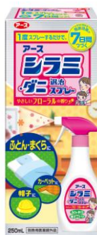
『アース シラミ・ダニ退治スプレー』

アース製薬株式会社（本社：東京都千代田区、社長：川端克宜）は、身の回りのもののシラミを簡単に駆除できるスプレー『アース シラミ・ダニ退治スプレー』を2017年2月20日から全国で発売いたします。