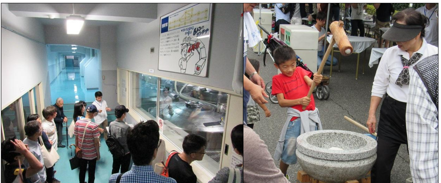
*写真は昨年秋の酒蔵開放の様子

白鶴ホームページ : http://www.hakutsuru.co.jp/customer/