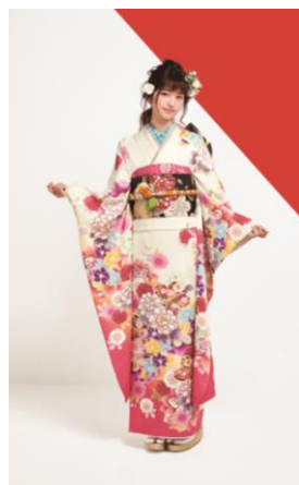
製品型番 : No.86634