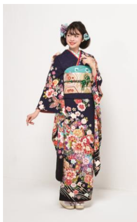
製品型番 : No.26452