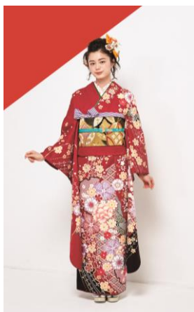
製品型番 : No.10164