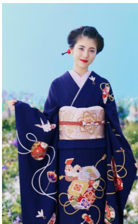
製品型番 : No.221