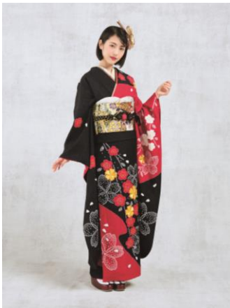
製品型番 : No.208