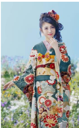
製品型番 : No.209