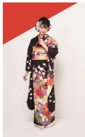
製品型番 : No.70381