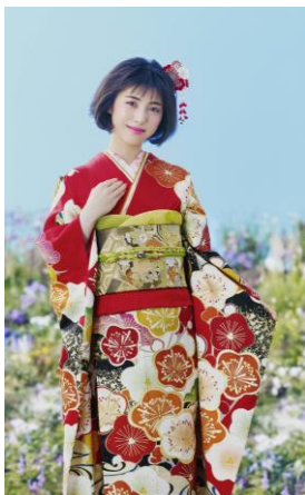
製品型番 : No.1857