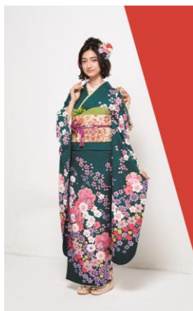
製品型番 : No.96336