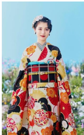
製品型番 : No.1961