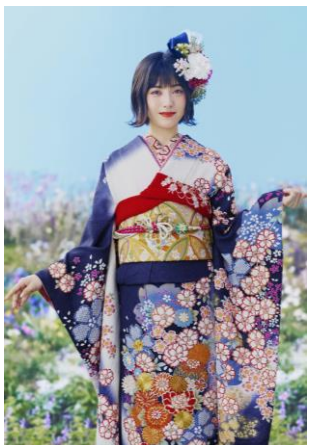
製品型番 : No.207