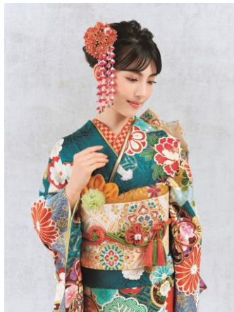
製品型番 : No.209