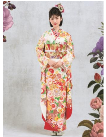
製品型番 : No.1962