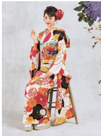
製品型番 : No.1961