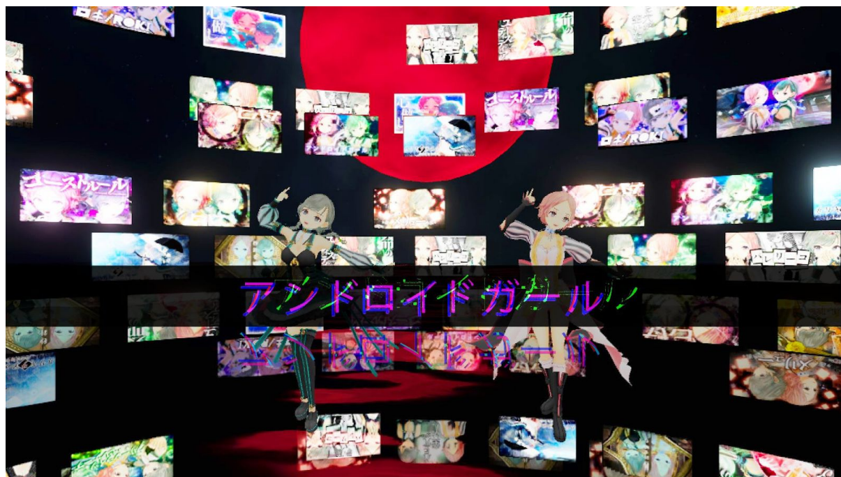
本コンテンツはSTYLY ARTIST PROGRAMの第1弾コラボレーション作品として制作されました。

VRミュージックビデオ「 アンドロイドガール 」を共同製作し、「 STYLY 」にて公開いたしました。