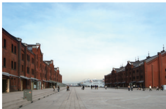
<横浜赤レンガ倉庫外観>

横浜赤レンガ倉庫は、開港の地横浜を象徴する歴史的建造物として2002年4月12日の開業して以来、2019年8月19日(月)に累計来館者1億人のお客様をお迎えすることができました。これを記念いたしまして、8月31日(金)に『1 億人達成記念イベント』として新港中央広場でオリジナルデザインの飛行船を運航いたします。