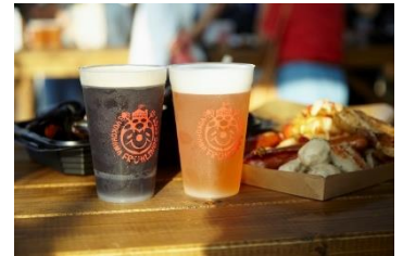
リユースカップ イメージ

地場の海鮮や野菜などの食材を使用した BBQ メニューをご提供するほか、地元醸造メーカー等の地元企業が出店します。