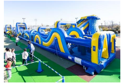
巨大アスレチック“エアertimeラン” イメージ