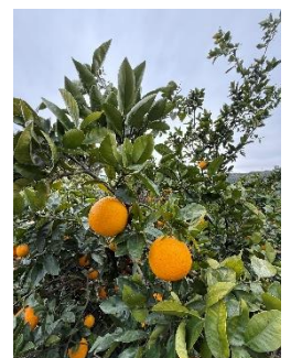
矢郷農園の河内晩柑