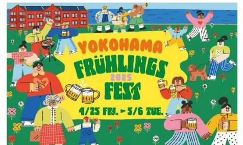
『Yokohama Frühlings Fest 2025』キービジュアル