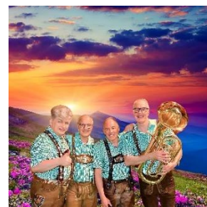
ドイツ楽団 イメージ