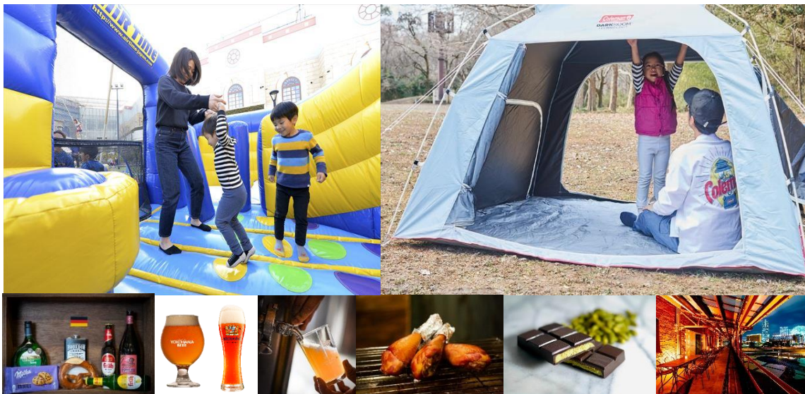
『Yokohama Frühlings Fest 2025』のコンテンツ・メニュー・施設一例

横浜赤レンガ倉庫では、2025年4月25日(金)から5月6日(火・祝)の計12日間、横浜赤レンガ倉庫イベント広場・赤レンガパークにて『Yokohama Frühlings Fest 2025』を開催します。メニューやコンテンツの詳細が決定したためお知らせします。