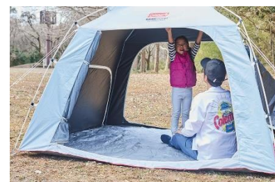
ピクニック イメージ