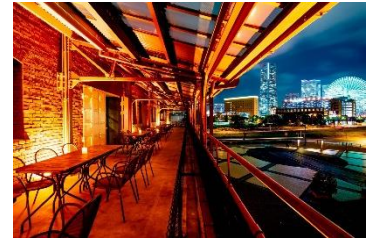
横浜赤レンガ倉庫 2号館 3F バルコニー席

横浜赤レンガ倉庫 2号館 3Fには、みなとみらいや横浜港を一望できる眺めの良いバルコニー席をご用意しており、海からの風を感じながら至福の時間を過ごせます。バルコニー席でお楽しみいただける2号館 3Fレストランのメニューをご紹介します。