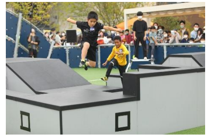
パルクール鬼ごっこ イメージ