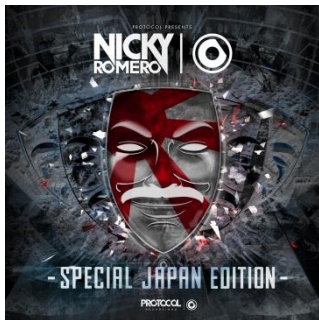
『PROTOCOL PRESENTS: NICKY ROMERO -SPECIAL JAPAN EDITION-』

さらに10月7日には、世界三大EDMフェスのひとつと呼ばれるベルギーの巨大野外フェス「TOMORROWLAND」のオフィシャル・コンピレーションアルバム『TOMORROWLAND 2015 - MELODIA』のリリースも決定しています。