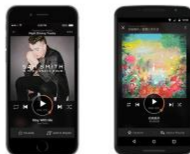
サービス画面のイメージ

※アクセスする端末により、自動的に App Store、Google Play のアプリダウンロード画面にリンクします。