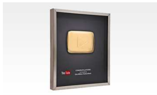
【登録者数100万人認定「金の再生ボタン」】