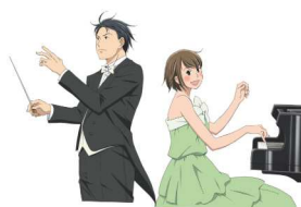
「のだめカンタービレ」