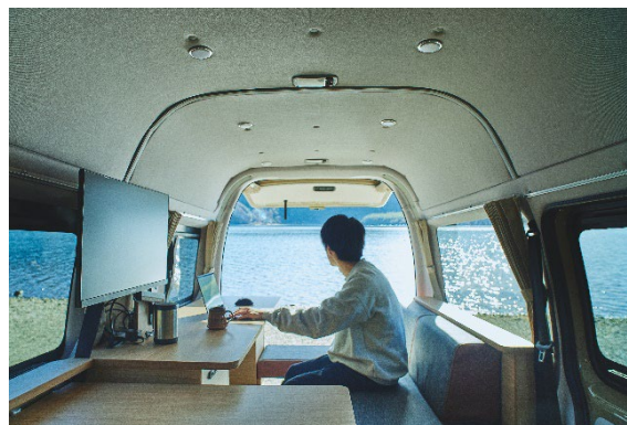
< mobica sand 車内 >