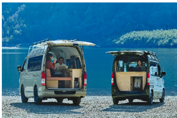
< mobica forest / sand >

mobica は市販車をワークスペースに架装したもので、ハイエース（TOYOTA）と N-VAN（Honda）を架装した 2 種類展開です。ハイエースタイプは「mobica sand」、N-VAN タイプは「mobica forest」と名付け、ご利用シーンに合わせて車両をご選択いただけます。どちらの車両も業務や気分に合わせて自由に働くスペースを選び、カスタムできる仕様となっています。車両にはソーラーパネルを搭載し、必要電源やプライベートスペースの確保が可能な為、災害などの有事の際は個室避難所としての提供も検討しています。