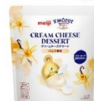
バニラ風味 クリームで濃厚な味わいの バニラ風味