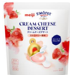
ストロベリー風味 クリームでやさしい旨味の ストロベリー風味