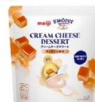
キャラメル風味 濃厚で絶妙なほろ苦さが使った キャラメル風味