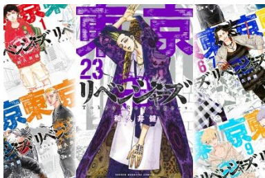
東京卍リベンジャーズ 1-24巻セット (9/17最新巻発売)