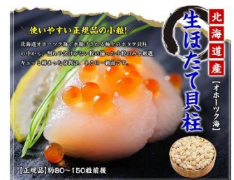
北海道産お刺身生ほたて貝柱たっ ぷり1kg (約80～150粒前後)