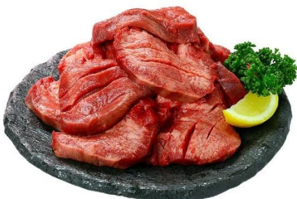
プレミアム牛たんステーキ (塩味) 500g/約6～7枚入り/約2～3人前