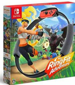
任天堂 リングフィット アドベンチャー HAC-R-AL3PA