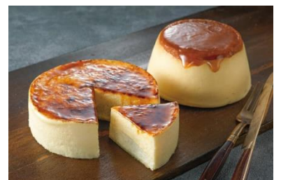
神戸チーズケーキ食べ比べセット (バニラフロマージュ+ドンプリンフォルマッジ)