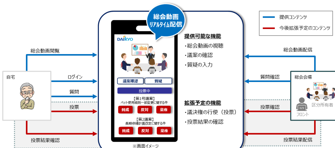
WEB 総会の仕組みイメージ

今後は、理事会の実際の場合と WEB 参加の双方向で対話可能な「WEB 理事会」サービスの開発やその場で議決権行使が可能な「WEB 総会」サービスにも将来的に対応できるよう検討してまいります。