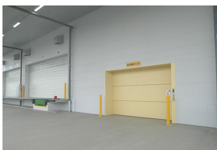
【貨物用エレベータ】