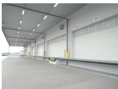
【庇下の荷役スペース】

さらに、倉庫及び事務所の全館で LED 照明を採用し、屋上には太陽光パネル(約 500kW)を敷設するなど、環境にも配慮した施設です。