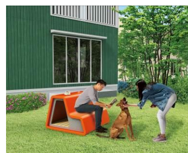
【ドッグハウス・ドッグランイメージ】

※7. アイペット損害保険調べ（2015 年） http://pedge.jp/reports/house/