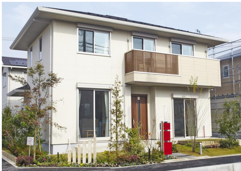
「アクティブ土間のある家」外観