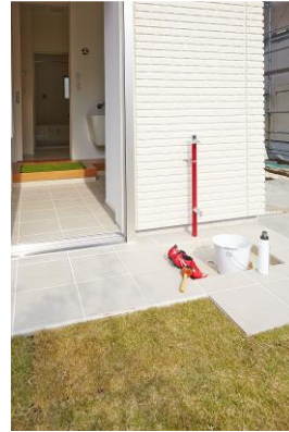
【どろんこウォーク】