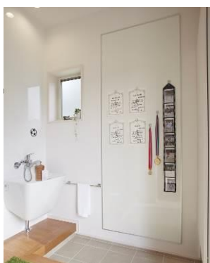
【たからものギャラリー】