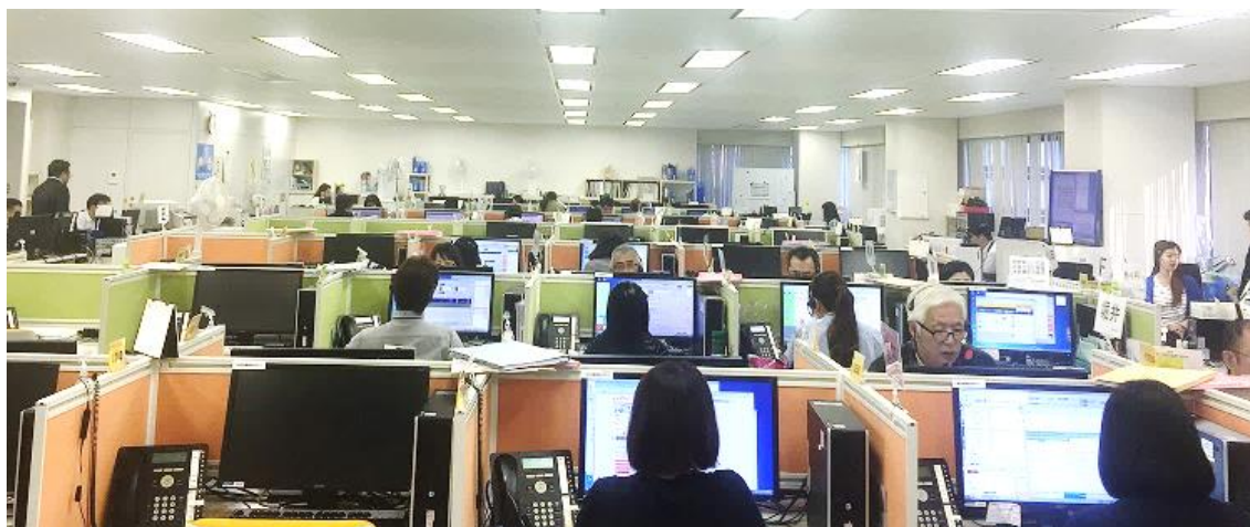
当社のコールセンター(大阪市中心部)

このたびの受賞を励みに、お客さま満足度の向上はもちろん、契約先企業様の業務改善・事業拡大にも貢献できるよう、さらなる品質の向上に努めてまいります。