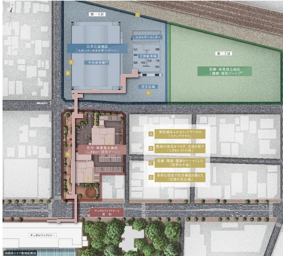
【「北4東6周辺地区第一種市街地再開発事業」(概略図)】

本物件は、当事業の「にぎわい・居住ゾーン」に、地上21階建、総戸数275戸の高層ツインタワー分譲マンションとして建設し、1階には商業施設が入居する予定です。