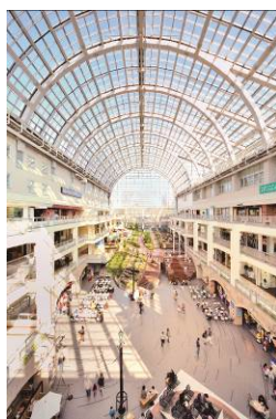
「サッポロファクトリーアトリウム館」