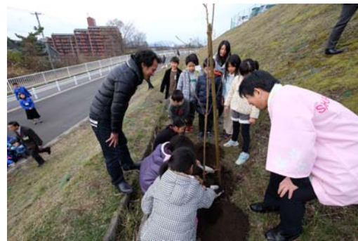
【桜プロジェクト 植樹のようす】