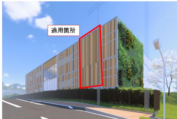
【フジタ技術センター附属棟 パース図（2025年9月末竣工予定）】