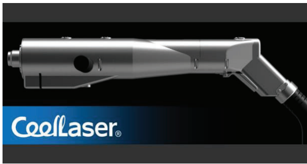
【高出カサビ取りレーザー：CoolLaser】