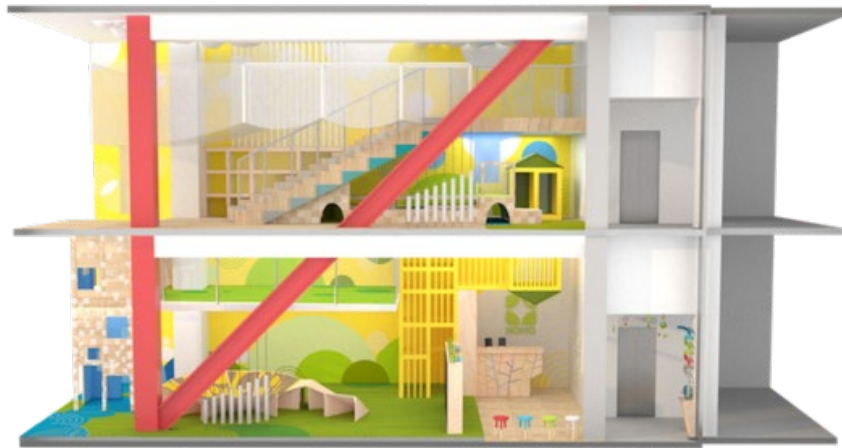
2層吹き抜けの空間