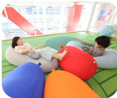
リラックスしてゆっくり遊べる エリアも設置