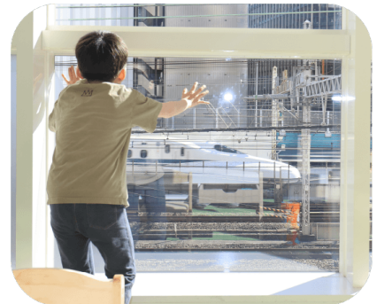
電車や新幹線の往來が見える線路を 見下ろすロケーション