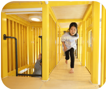
縦方向に自由自在に行き来できる フロア