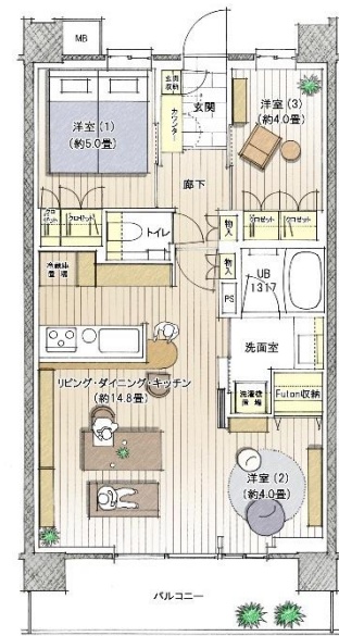
E1タイプ リビング・ダイニング・キッチン完成予想CG / 間取り図