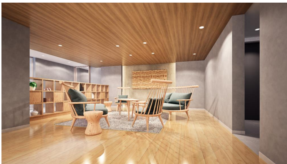
『イニシア池上パークサイドレジデンス』 共用ラウンジ完成予想 CG

「家族のチームワーク醸成」というコンセプトを掲げ、エントランスホールやラウンジは暖色系のやさしい色合いでコーディネートし、フローリングのラウンジには、飛驒産業から提案いただいた木工家具をふんだんに取り入れました。住まう方々が自然に集いたくなる居心地の良い空間を目指しました。ラウンジスペースに配置するソファは、親子が一緒に座りやすい形状にし、また、エレベーター側に置くスツールは、子どもたちがエントランスホールに先に降りて、座りながらパパやママを待っているイメージです。つくり付けのブックシェルフやアイキャッチとなる壁面の「小口パネル」も、「共用部」に設置する事で視覚的なぬくもりだけでなく、住まう事で家族や人、この地域の持つ温かさを感じてもらえるように設計しています。