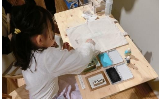
HIDA 東京神谷町店 / ワークショップイベントの様子