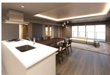
【パーティールーム】