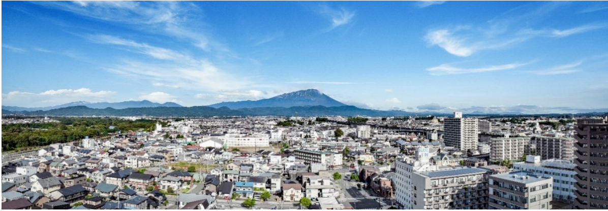
【15階（北西向き）住戸からの眺望イメージ】