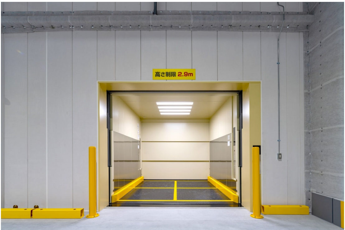
【荷物用エレベーター】