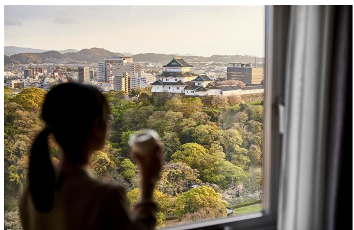
【室内から見える和歌山城】