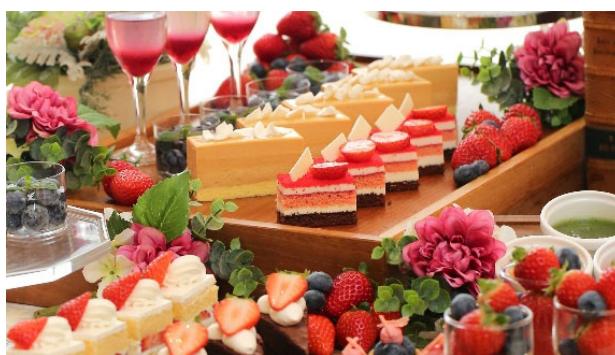
【ベリースイーツブッフェ】