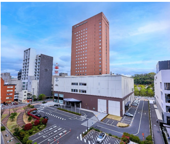
【ダイワロイネットホテル和歌山外観】

なお、ホテルのリニューアルオープンに合わせ、商業施設「モンティグレ ダイワロイネットホテル和歌山」の外装や商業部分の内装、結婚式場、レストランなども改装しました。