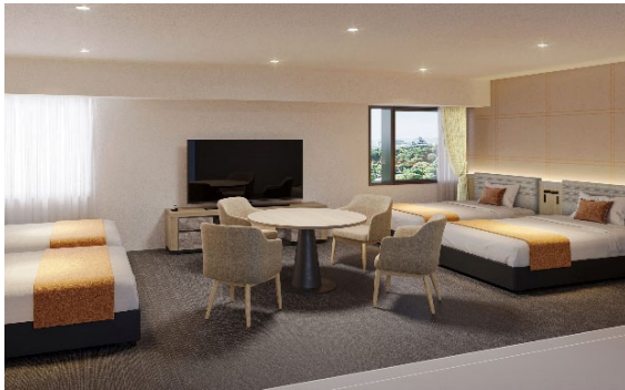
【ファミリーフォースルーム】

和歌山城の石垣をイメージし、木目や石を用い、落ち着いた設えに改装しました。また、ご来館のお客様さまにリラックスしてご利用いただけるよう、ベンチソファを多くご用意しました。落ち着いたかつゆとりのある空間で、窓からは和歌山城やチャペルをご覧ください。