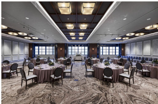
【プレジール（大宴会場）】