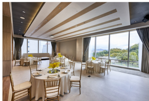
【ブランシェ（中宴会場）】