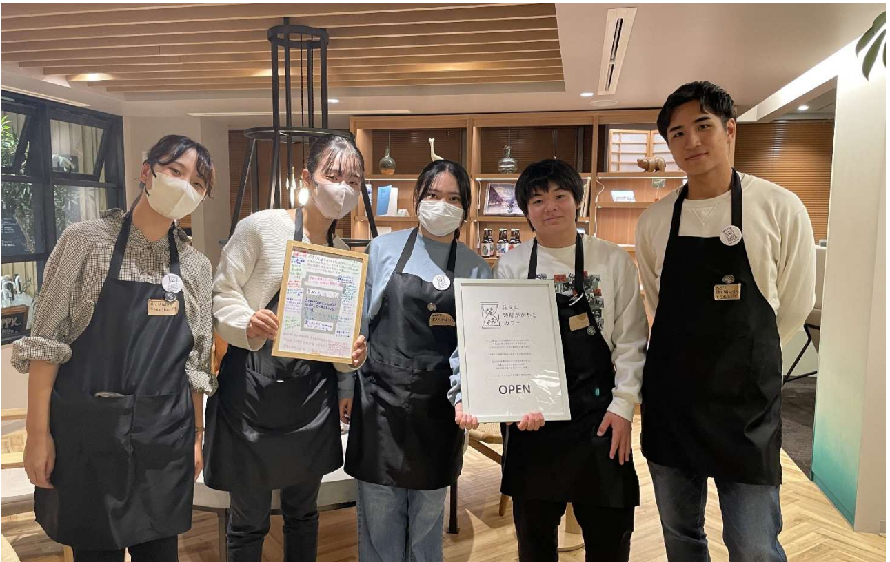
吃音当事者の学生スタッフ

大和ハウスグループの株式会社コスモイニシアは、当社が運営するシェアオフィス『MID POINT（ミッドポイント）』において、話し言葉が滑らかに出不い発話障害のひとつである吃音（きつおん）のある若者が接客にあたる、1日限定イベント「注文に時間がかかるカフェ」を実施いたしましたので、お知らせします。