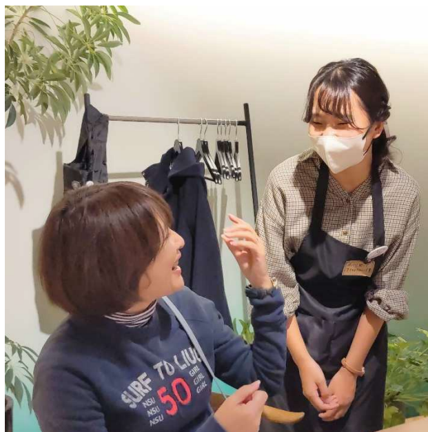
接客をするスタッフ