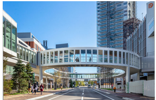
【アクティブリンク】