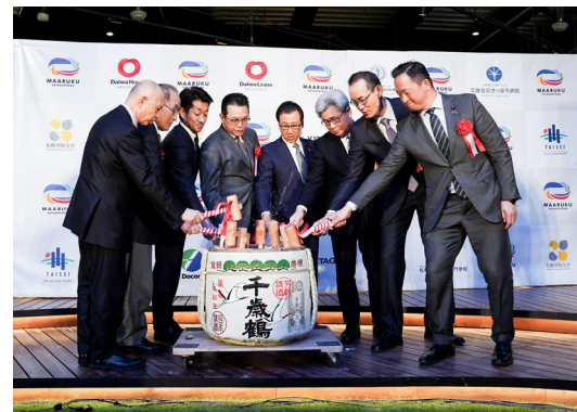
【まちびらきセレモニーの様子】

「マーク新さっぽろ」は、JR千歳線「新札幌駅」と地下鉄東西線「新さっぽろ駅」周辺に位置しています。「商業、ホテル、予防医療・地域医療、タワーマンション、子育て、産学連携、教育の7つの成長エンジン」をコンセプトとし、約55,700㎡（一部借地含む）を有した敷地を2街区に分け、G街区に大学や専門学校などの教育施設、I街区に共用駐車場、医療施設4棟、分譲マンション、ホテル、商業施設を開発した大規模プロジェクトです。