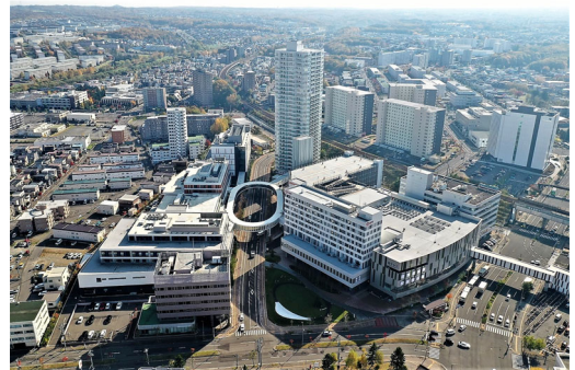
【「マーク新さっぽろ」I街区】

※2. 災害時に停電が起こった際にも電気は通常の約60%、熱はほぼ100%の供給を継続可能。