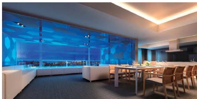
【ビューラウンジ（西棟 16 階）】