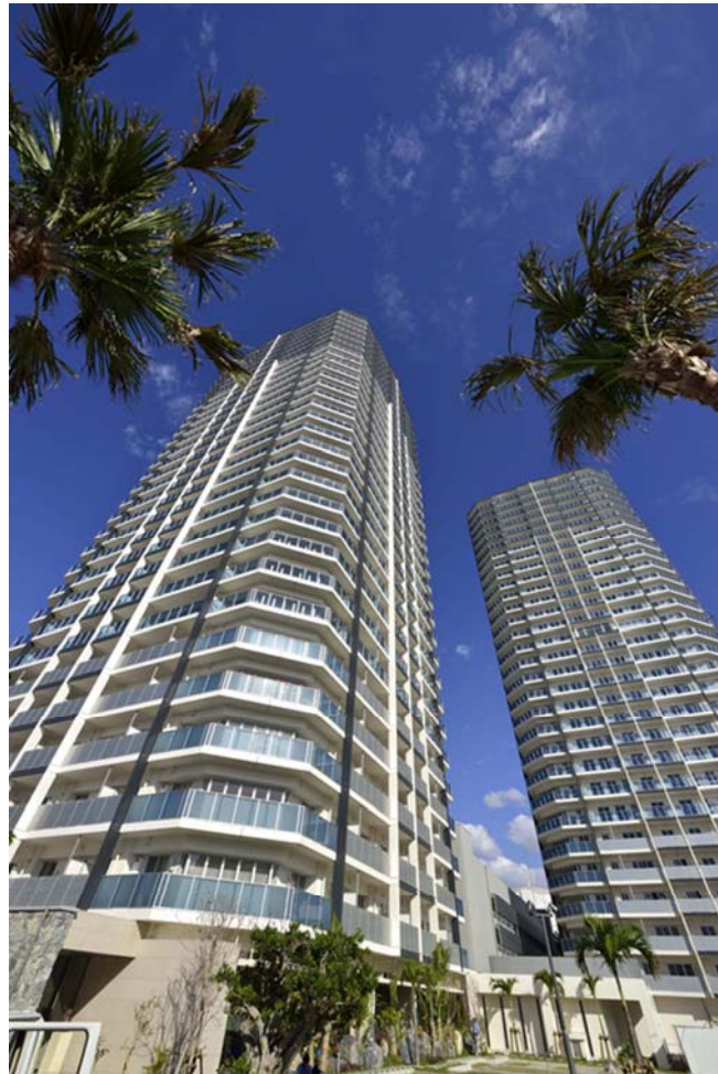
【「RYU : X TOWER (リュクスタワー)」】