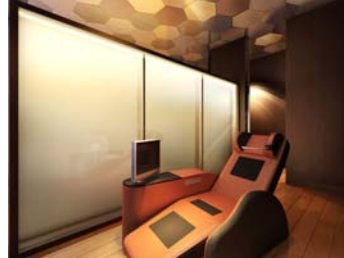
【エア ロビー (東棟1階)】 マッサージルーム