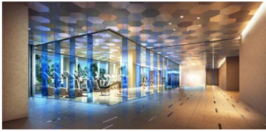
【エア ジム (東棟1階)】 フィットネスコーナー (有料)