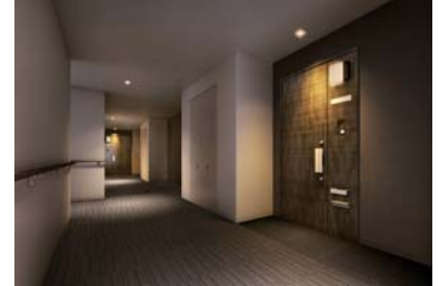
【ホテルライクな共用廊下】 風雨を気にすることがない空間