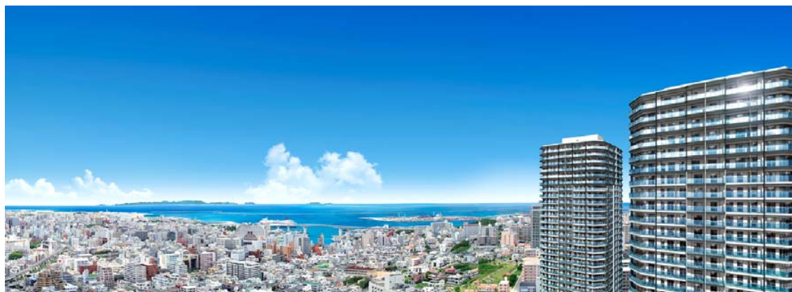
【東シナ海方面の眺望】