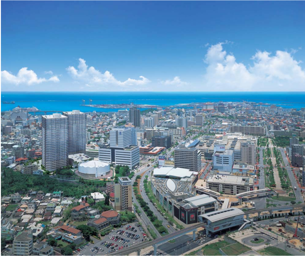
【「おもろまち」と「リュクスシティ」】