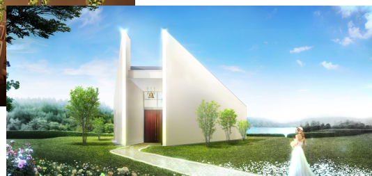
【 独立型チャペル「Lovista 愛の展望」 】(イメージ) 内観（トワイライト WEDDING） ・ 外観