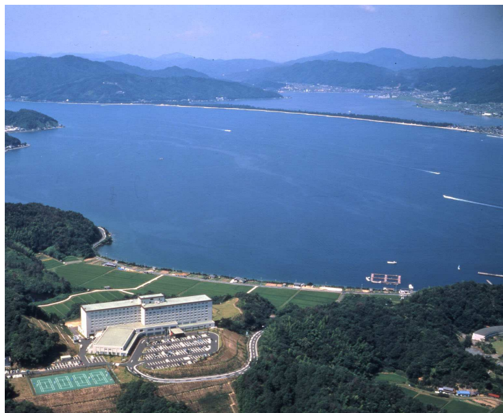
天橋立 宮津ロイヤルホテル 全景