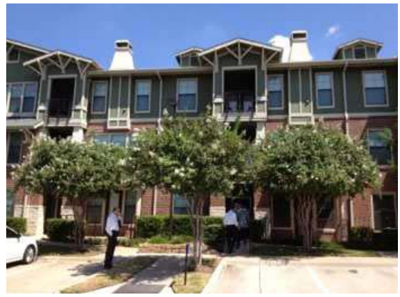
<現在の「パークレー I」>