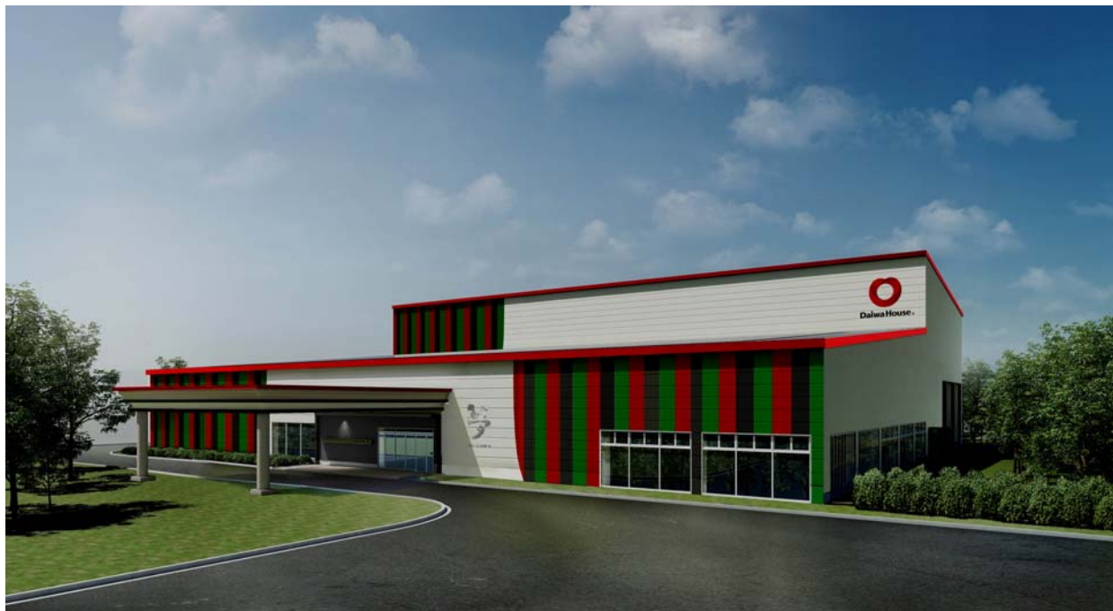
「D-room プラザ館 夢」外観パース