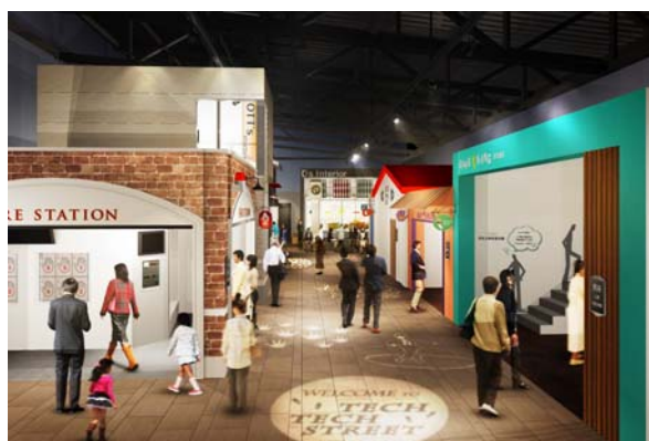
「テクテクストリート」

“テクテク歩きながらテクノロジーを楽しんで見ていただける通り”というコンセプトでつくられた「テクテクストリート」では、お子様でも理解できるよう、体感を重視したブースコーナーを数多く取り入れました。