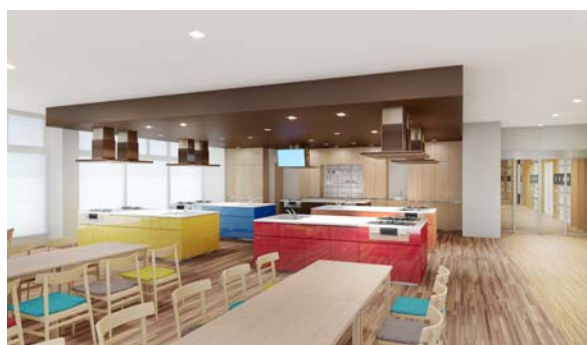
「クッキングテラス」

「クッキングテラス」では月に数回、当社グループの大和リゾート株式会社が運営するダイワロイヤルホテルズよりシェフを招いて、土地オーナー様（全国オーナー女子会 ※4 ）を対象に料理教室のイベントを開催する予定です。