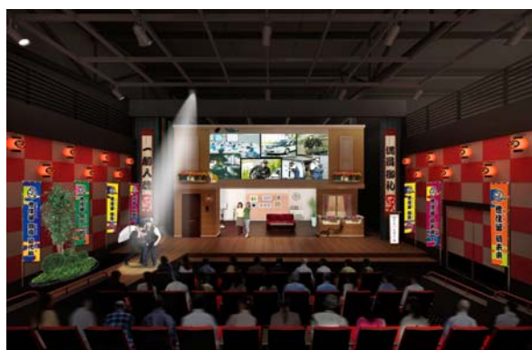
「笑福座（イメージ画像）」

奈良の「D-room プラザ館」でも、土地オーナー様から「普段から接する当社社員が芝居をすることで、より楽しんで学ぶことができる」と好評をいただいています。また、「D-room プラザ館 夢」では演目も増やし、時流にあわせた内容に随時更新していきます。