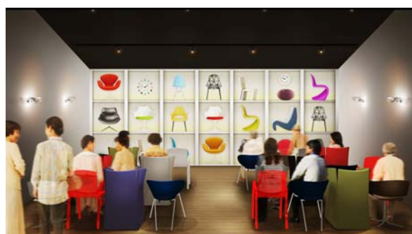
「九尾の狐シアター」