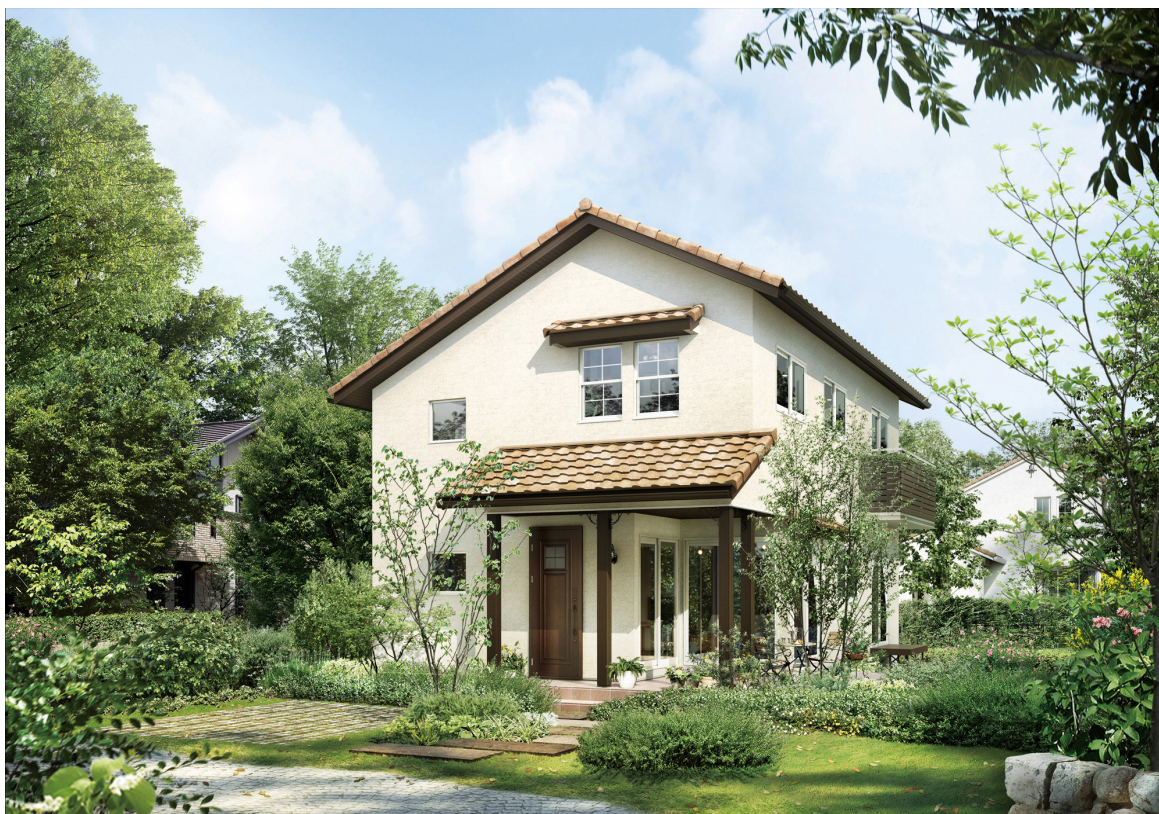
「Maison des quatre saisons×xevo(フレンチスタイル)」

http://www.daiwahouse.co.jp/jutaku/lifestyle/qsd/index.html?ad=pr