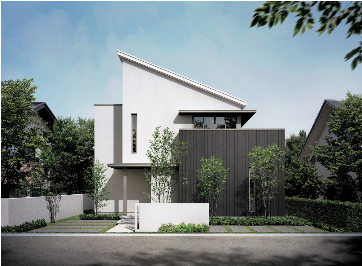
「BoConcept×xevo(シェードルーフスタイル)」

http://www.daiwahouse.co.jp/jutaku/lifestyle/boconcept_d/index.html?ad=pr