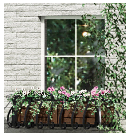
「フラワーボックス」