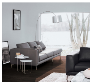
「アーバンシックモダン」