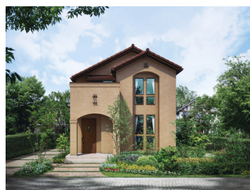
「エレガントスタイル」