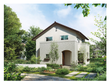
「エレガントスタイル」