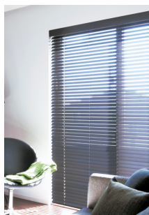
「ウッドブラインド」