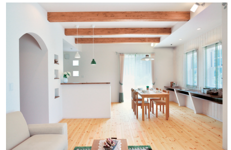
「フレンチ・シャビー・コーディネート」

内装デザインは、白をアクセントとした「フレンチ・シンプル・コーディネート」と木の温もりが感じられる「フレンチ・ナチュラル・コーディネート」に加え、新たにミディアムブラウンを基調とした落ち着いたデザインの「フレンチ・シャビー・コーディネート」を追加することで、男性や40代以上の女性にも好まれる落ち着いたデザインを採用しました。