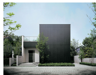
「フラットルーフ スタイル」