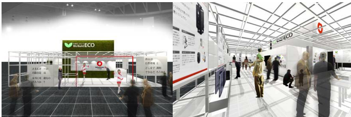
当社出展ブース（イメージ）

http://www.daiwahouse.co.jp/eventHP/detail/index.asp?event_id=104431