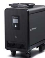
「パワーイレ・プラス」

当社グループの「省エネ」「創エネ」「蓄エネ」等の環境エネルギー事業について紹介します。可搬式リチウムイオン蓄電システム「パワーイレ・プラス」の通電体験やメガソーラー等のパネル展示をします。