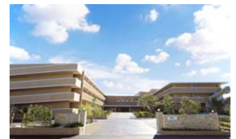
「ネオ・サミット茅ヶ崎」