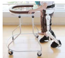
「ロボットスーツ HAL®福祉用」

※4. 「メンタルコミットロボット」は独立行政法人産業技術総合研究所の登録商標です。「パロ」は株式会社知能システムの登録商標です。