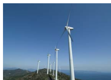
佐田岬風力発電所