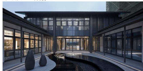
【中庭(エントランス棟)】