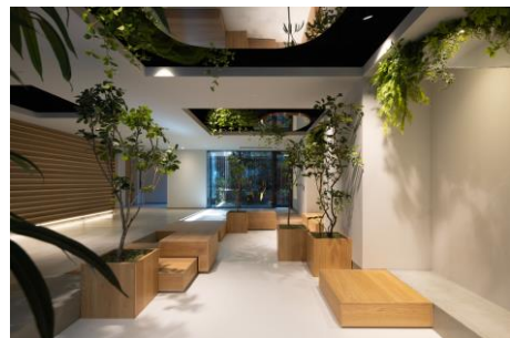
【共用エントランス内】