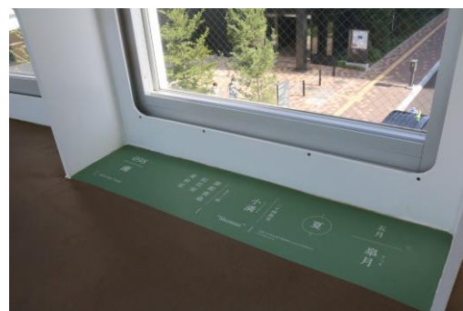
【野幌の自然や四季を表現した床サイン】