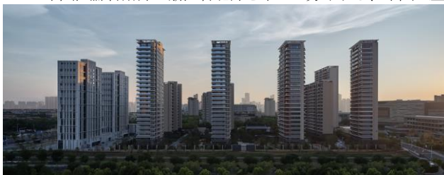
【水平ラインを強調した外観】

※5. 中国江蘇省南部と浙江省北部を中心に分布する、中国の歴史ある街並みを残した景勝地