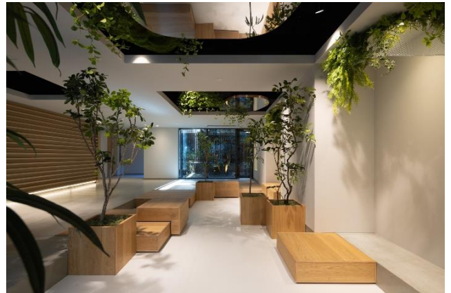
『コスモグラシア両国レジデンス』 エントランス外観/エントランス内部