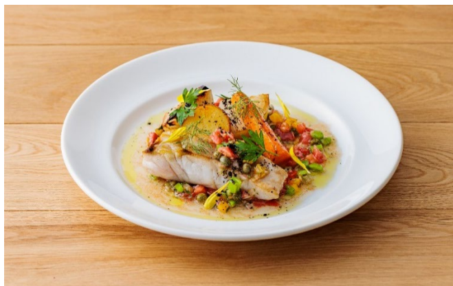
【未利用魚を活用したランチメニュー】