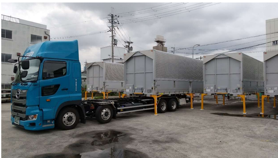
スワップボディコンテナの交換の様子