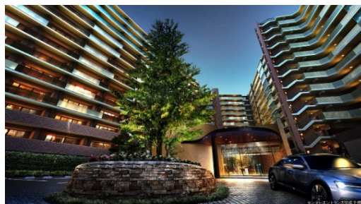
【センターエントランス イメージ】

「プレミスト昭島 モリパークレジデンス」は、JR 青梅線「昭島駅」北口より徒歩 5 分の昭和飛行機都市開発株式会社が保有していた土地の一部において建設中の、大型複合商業施設やスポーツ施設・ホテルなどが集積した都市型リゾート「東京・昭島 モリパーク」※1内初の住宅プロジェクトです。