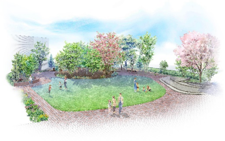
【ギャザリングパーク イメージ】

本物件の敷地内緑地は、生物多様性貢献面積率を 19%以上確保しました。敷地内に設けた「ギャザリングパーク」では、高木層や低木層など階層構造を確保した緑地を創出し、シンボルツリーとしてヤエザクラを配置したほか、地域の在来種を中心とした植栽計画を採用しました。また、中庭には複数のレインガーデンを設置することで、雨水を浸透貯留させるほか、生物多様性の向上にも貢献し、「ABINC 認証」を取得しました。