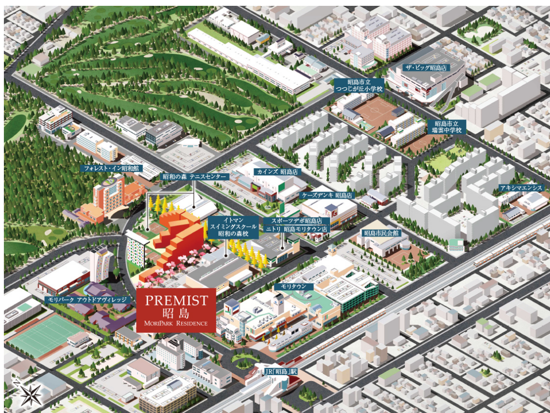
【物件周辺イラストマップ】