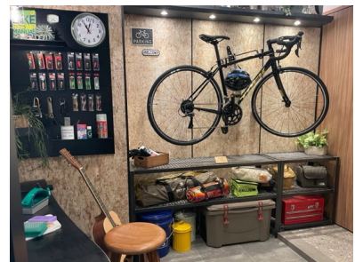
【土間スペース イメージ】