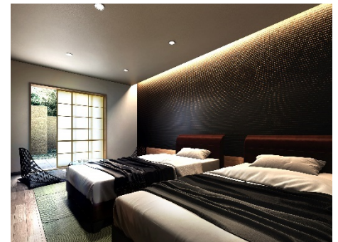
【ゲストルーム イメージ】