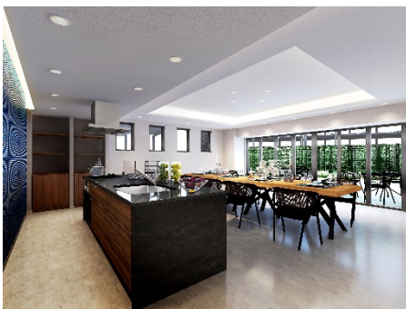
【パーティーパティオ イメージ】