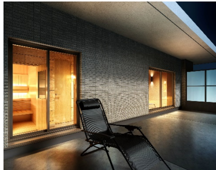
【プライベートサウナ イメージ】