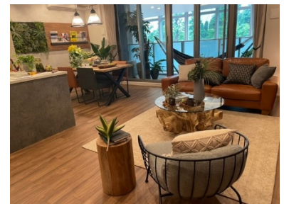
【リビング イメージ】