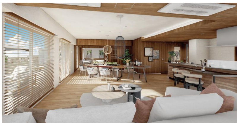
【「プレミスト首里金城町」の住戸】

本物件は、総戸数67戸のうち13戸が1億円を超えており、販売価格は6,238万円～2億1,846万円、平均価格帯は9,524万円となっています。リゾートライフを楽しむことができる166.6㎡の住戸（1億6,988万円）は、幅約14.6m、奥行最大5.5mのバルコニーや、レジャー用品が収納できるトランクルーム、充実したサニタリールームを設置しました。