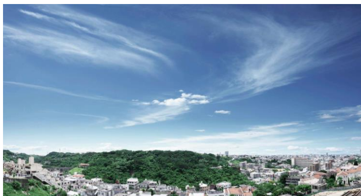
【「プレミスト首里金城町」からの眺め】

「首里金城地区都市景観形成地域」は、10m以下の高さ制限や赤瓦などの意匠を採用することが基準となるなど、首里城周辺の歴史的・文化的な景観の保全に取り組む地域です。周辺には、琉球石灰岩の白い石畳に緑や花が添えられ、美しい景観を保っています。また、海拔約65mの高台からは、緑豊かな繁多川公園や那覇市内の街並み、東シナ海を望むことができ、沖縄県の四季折々の自然景観を楽しむことができます。