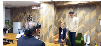
【使用例②：リモート面会】

「LIVE」は、「WHITEROOM」におけるマルチユーザー・マルチデバイス・マルチメディア技術と、高精細な立体映像を実現するポリュメトリックビデオ技術を融合させた機能です。