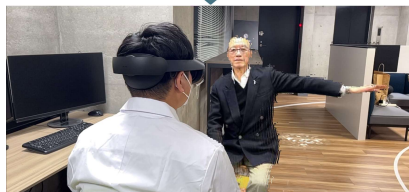
【使用例①：オンライン診療】

リアルタイムに生成された 仮想空間上の映像を現実空間 に重ねて投影している様子 (Mixed Reality)