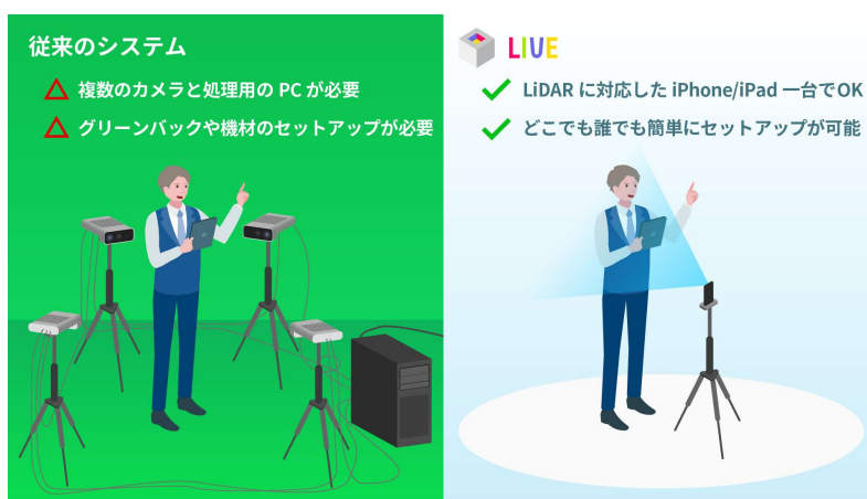
【従来のシステムと「LIVE」の比較】